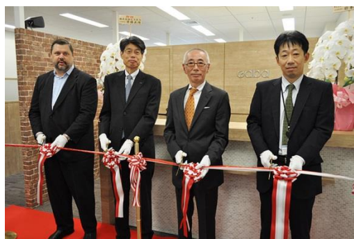
▲ オープニングセレモニーの様子

当社は法人向け英会話研修プランとして、契約先企業内に設置、運営する「スクール設置型」のサービスをご提供しています。通常のGaba LSと同等の設備を持った施設を契約企業内に設置するもので、専属のインストラクターとクライアントの英語学習をサポートするカウンセラーも常駐します。企業内にLSを設置することで業務の合間に英会話レッスンを受講することができ、効率的に英会話を学ぶことができるサービスです。